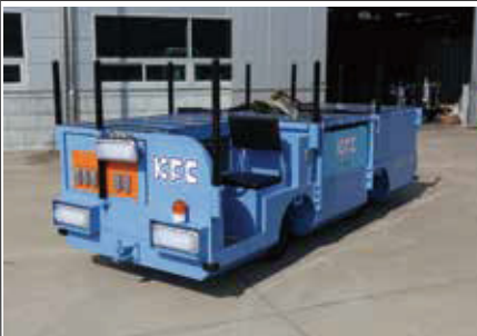
28. KFC1 터널공사용