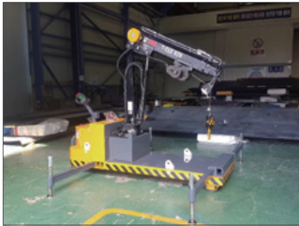
▼ SBC 히아브 크레인