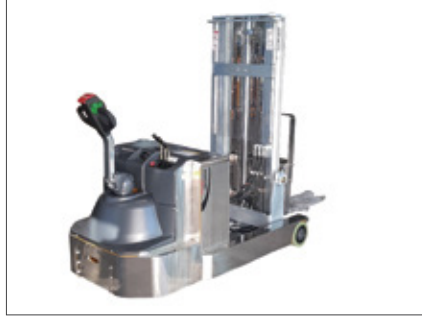
▼ SWR 중외제약 (ALL SUS TYPE)