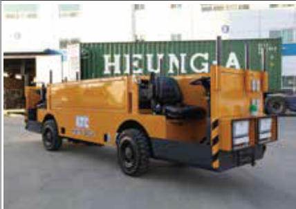
29. KFC2 터널공사용