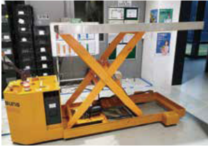
16. SWP STL 타입