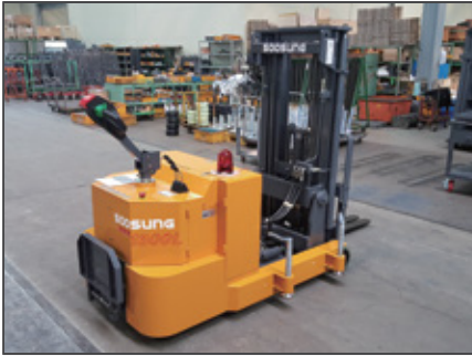
▼ SWR 아웃트리거 부착