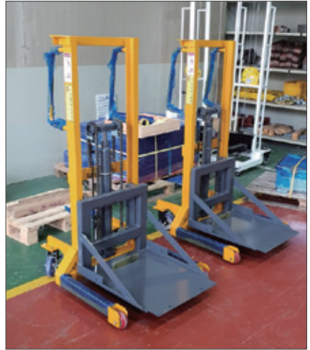
▼ SFH 25KA