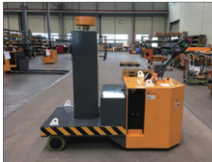
▼ SWP 대우조선해양