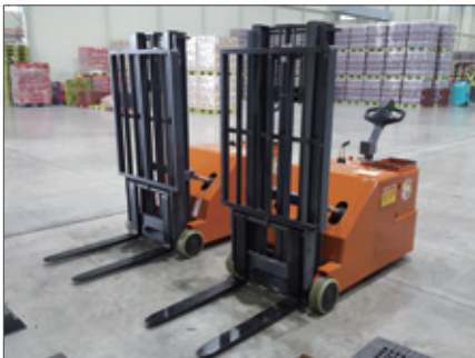
▼ SWP 코카콜라 타입