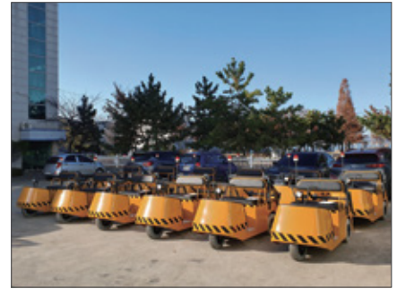
▼ SST-1000K 해외 싱가포르