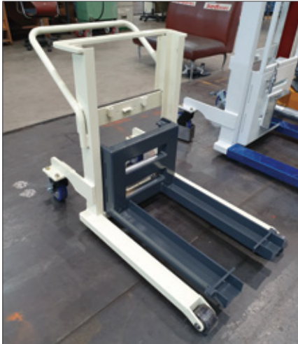
▼ SFH 포크 개조