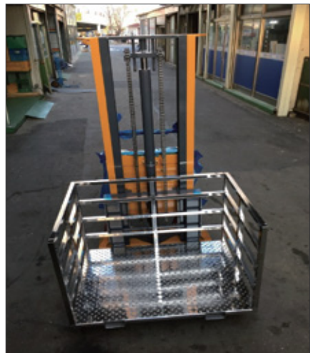
▼ SFE 테이블 SUS TYPE