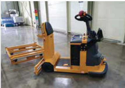
22. SCT 나르마파우스트 (무인대차)