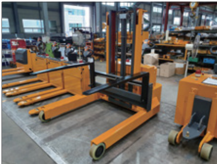
▼ SWS 역포크 타입