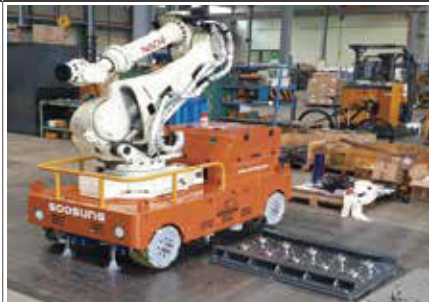
27. Dross Removal Robot Platform