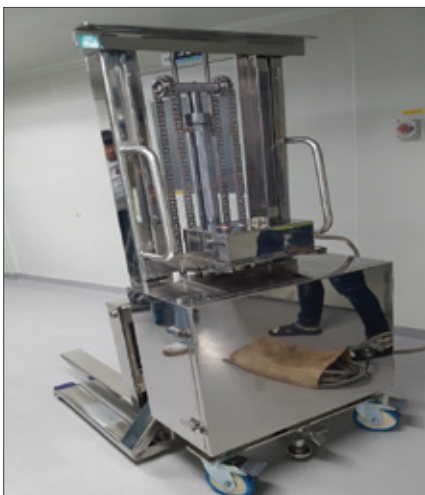
▼ SFN ALL SUS TYPE