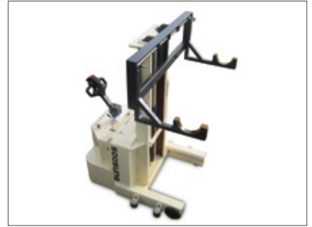
▼ SWS 걸이형타입