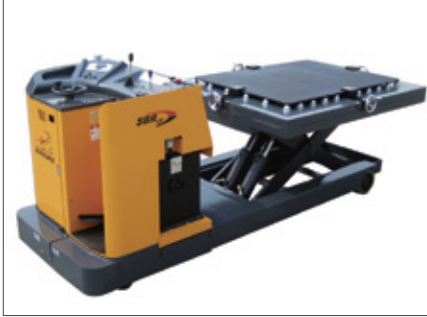
▼ SBR 착탈기 (철도전용장비)