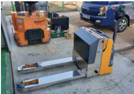
19. SWP SUS 포크