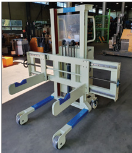
▼ SFE 걸이형 타입