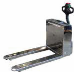
18. SWP SUS 타입 (식품, 제약회사)