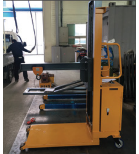
▼ SFE 트롤리 타입