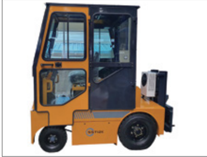
▼ SST 12000 견인고리 장착