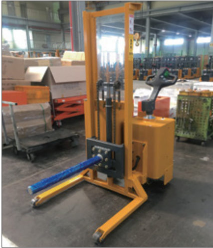
▼ SFE 봉타입