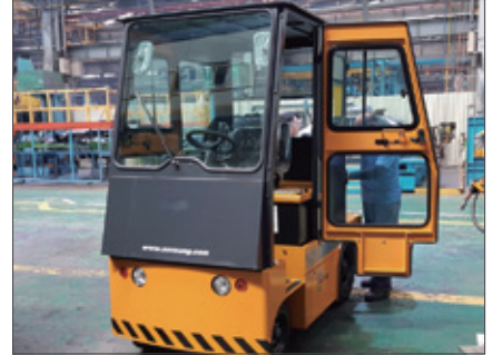
▼ SST 12000 풀캐빈