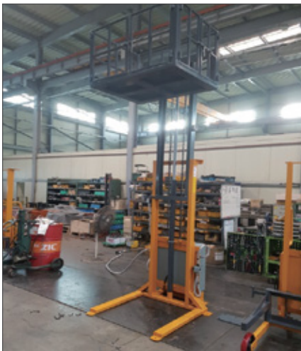
▼ SFN 방폭형+테이블 타입