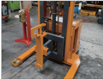
▼ SWS 드럼그래브