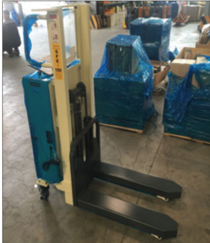
▼ SFE 포크 파렛트 타입