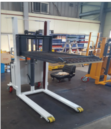
▼ SFE 테이블 타입