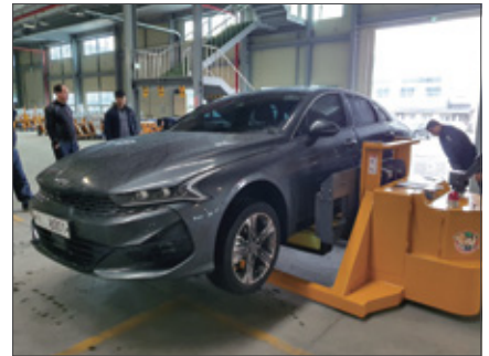
▼ SWS 기아자동차