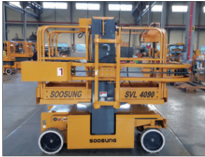
▼ SSL 일본 가나모토