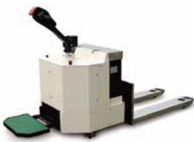
17. SWP SUS 타입 (Fork _ 분체도장)