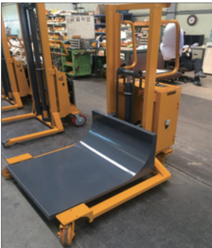
▼ SFE 롤타입