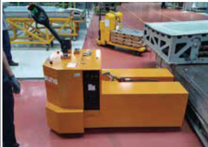
20. SWP 견인타입