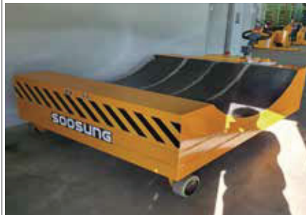
21. SWP 대차타입