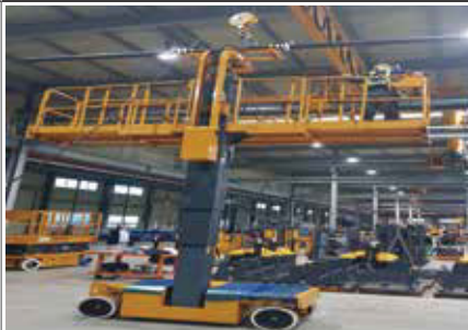
26. SSL 일본 가나모토