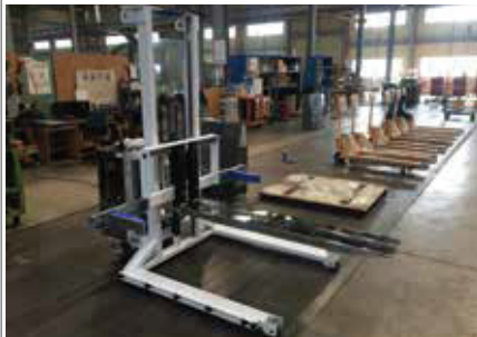
23. SFE 고하중용