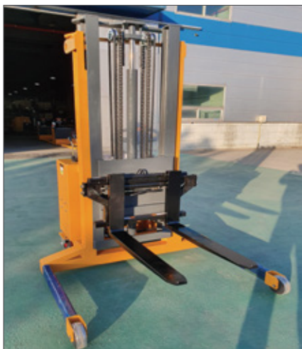
▼ SFE 사이드쉬프트