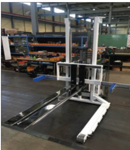
▼ SFE 고하중용