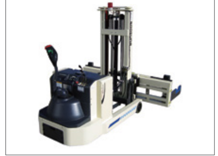
▼ SWR 걸이형타입